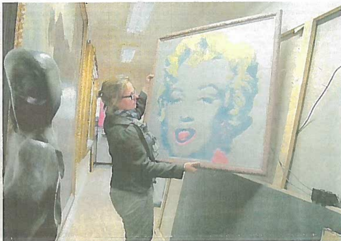
Le musée du Touquet dispose encore de terrains constructibles. Parfait pour s'agrandir et accueillir les donations comme celle, récente, d'une centaine d'œuvres originales et de sérigraphies (ci-dessus).

PAR OLIVIER MERLIN montreuil@lavoxdunord.fr