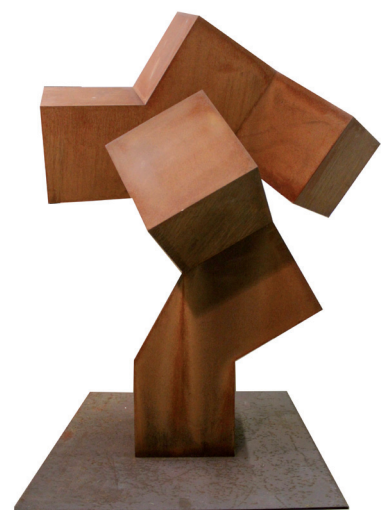
Norman Dilworth - Clump Acier corten - 150 x 170 x 240 cm - 2009

Pour en savoir plus : http://www.letouquet-musee.com